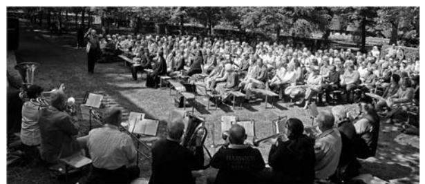
Himmelfahrtsgottesdienst im Hofgarten 2015

So 28. Mai 17 Uhr St. Johanniskirche Konzert - Windsbacher Knabenchor (siehe Seite 2)