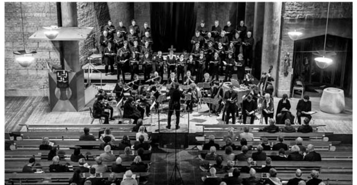
Johannespassion, 8. April 2017, mit Kammerchor des Bachchors „würzburg.vokal“ und Barockorchester