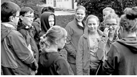
Konfi-Freizeit in Leinach, Oktober 2015

16 junge Menschen haben sich in unseren Gemeinden in den vergangenen zwei Jahren auf ihre Konfirmation vorbereitet. Was haben sie dabei erlebt und was wird wohl davon bleiben? Wir haben mal nachgefragt und diese Antworten erhalten: