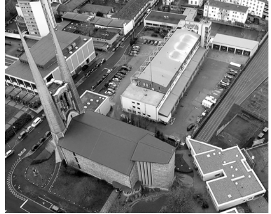
Im Vordergrund Johanniskirche und Kinderhaus